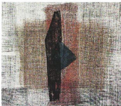
CONFRONTO A sinistra e sotto al centro: due «Monoprint e collage» di Domenico Regazzoni A destra: «Elegance», una stampa su seta di Lu Zhiping

EXPO ED ECOLOGIA PER LA PRIMA VOLTA AL CONCORSO PIEMONTESE PARTECIPANO LE SCUOLE