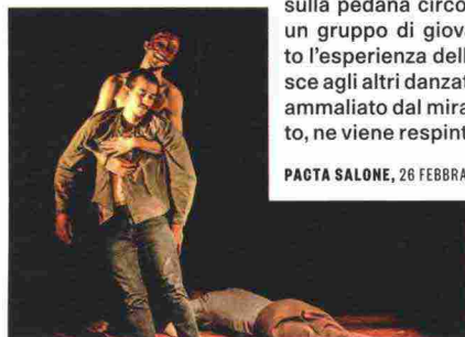
Un passo del balletto BOLERO Europa.

PALAZZO D'ACCURSIO, SALA D'ERGOLE, 28 FEBBRAIO-19 MARZO. REGAZZONI.NET