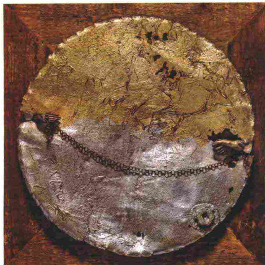
Ciao (2016) di Domenica Regazzoni.