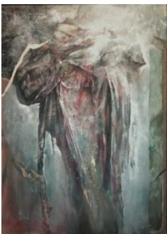
Velasco-Drappo, 1985-T.M.su carta app.su tela, cm 100x72