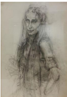
Kei Mitsuuchi-Carmen, 1986-matita su carta, cm 55x37,5