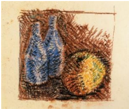
Lalla Romano-Bottiglie azzurre, 1930-pastello ad olio su carta, cm 20x28