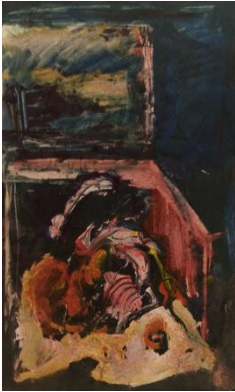
Vittorio Bellini-Natura morta, 1993-Tecnica mista su carta, cm 54x33