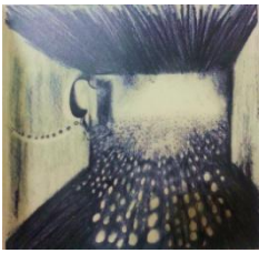
Enzo Cucchi-Fontana vista, 1987-matita su carta, cm 25x25