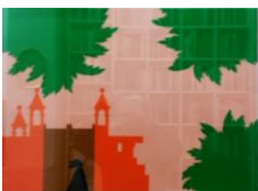
Beni Montresor-Le streghe di Venezia, 1993-Collage, cm44x61