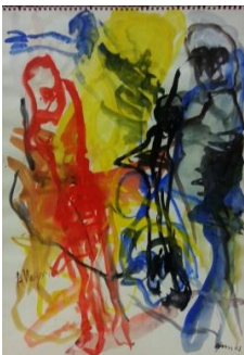
Klaus Prior-Allegria, 2005-Tecnica mista su carta, cm 59x42