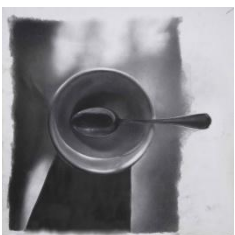
Andrea Boyer-ABW 292, 2007-matita su cartone schoeller, cm45x45