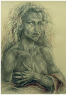
Elena Mutinelli-Penia, Tecnica mista su carta, cm 100x70