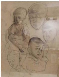
Eugene Bloch-Studio per ritratto di Bambini, 1927-matita su carta, cm 42,5x32