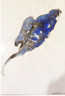
Antonio Mottolese-Senza titolo, 2009-Tecnica mista su carta, cm 33x24