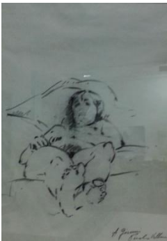
Paolo Vallorz- Nudo sdraiato,1982-matita su carta, cm 38x27