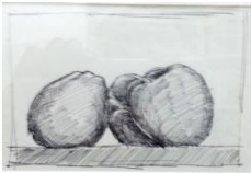
Paolo Vallorz-Le mele, 1978-penna biro su carta, cm 13x21