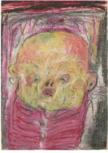
Sergio Battarola-senza titolo, 1988-pastello, cm 35x25