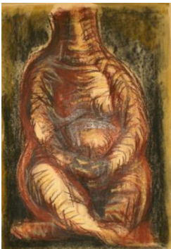
Samuele Gabai-Grembo, 1995-Tempera su carta, cm 50x35