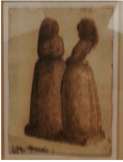
Giuseppe Gorni-Confidenze, 1917-inchiostro su carta, cm 12,2x8,5