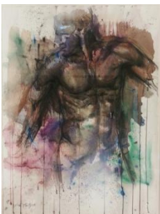
Jhon Keating-Nudo Virile, 1994-Tecnica mista su carta, cm 76x57