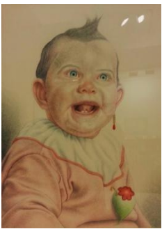
Luca Crocicchi-Ritratto di bambina, 1983-tecnica mista su cartone, cm 44,5x33