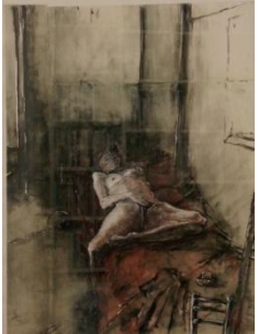
Giovanni Frangi-nudo sdraiato, 1982-T.M. su carta, cm 50x37,5