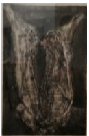
Giancarlo Vitali-Toro squartato, 1985-acquaforse, mm 218x145