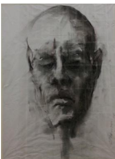
Carlo Previtali-Testa di Hermann,2008-Carboncino su carta, cm 44x32