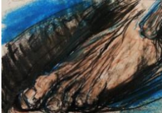
Fabio Linari-II piede di Mercurio, 2006-pastello ad olio, cm 20,5x29