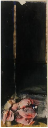
Alessandro Verdi-Figura, 1985-Tempera su carta, cm 65x24