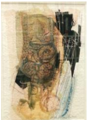
Giacomo Soffiantino-Senza titolo, 1990-tecnica mista su carta, cm 22x15,5