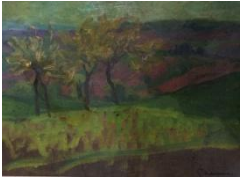
Combet-Descombes-olio su cartone, cm 24x32,5