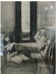
Jose Jardiel-Senza titolo, 1965-matita su carta, cm 64x49