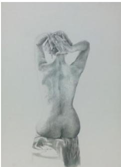
Rossella Gilli-Nudo di schiena, 1996-litografia, cm 64x47