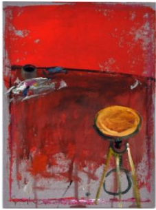
Emanuele Gregolin-Atelier oggetti, 2011-olio su cartone, cm 28x21