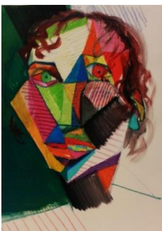
Fausto Faini-Ritratto, 1983-Tecnica mista su carta, cm 70x50