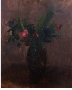
Combet-Descombes-olio su carta, cm 42x32