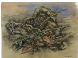
Antonio Stagnoli-Fiori secchi con figura, 2000-acquarello e chiona su carta, cm29,5x38,5