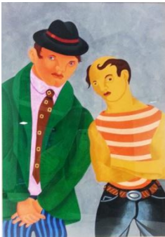
Luca Bertasso-Mafiosi, 1996-tempera su carta, cm 48x33