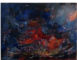
Giovanni Testori-Tramonto (le rondini disperate), 1967-acquarello, cm 19,5x25,5