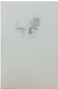
Vincenzo Nisivoccia-Ritratto 4, 1995-matita su carta, cm 48x33