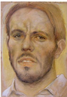
Andrea Martinelli-Studio per un ritratto, 2002-pastello su carta, cm 34,5x25