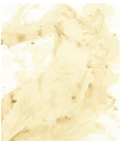
Christian Zucconi-studio anatomico (1)-2012