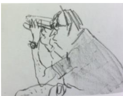
Varlin-Mann mit dem-carboncino su carta, cm