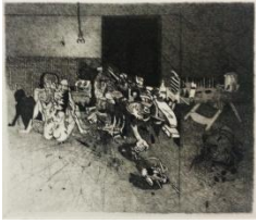
Gianfranco Ferroni-Senza titolo, 1963/73-acquaforte, mm 160x180