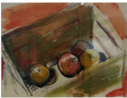
Luca Vernizzi-Natura morta, 1993-acquarello su carta, cm 30x40