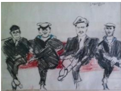
Varlin-Viareggio, 1965-carboncino e matite colorate su carta, cm 49x66